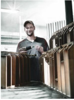
Bits mit reduziertem Schaftdurchmesser