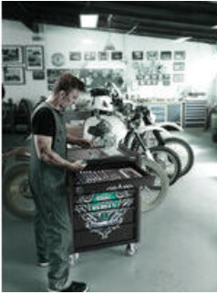
Exklusiver Werkstattwagen im Tool Rebel Design