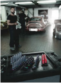
Die Wera Belts