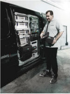
Wera 2go 1 - Der Dranpacker