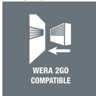
Wera Verpackungen, die dieses Symbol aufweisen, beinhalten Werkzeugtaschen oder textile Boxen mit Vlieszone, die sich an das Wera 2go-System andocken lassen.