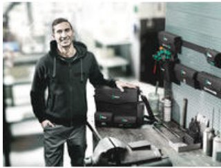
Wera 2go 2 - Der Dran- und Drinpacker