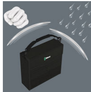
Das robuste und formstabile Material schützt die mitgeführten Werkzeuge vor Beschädigungen und Nässe und erhöht die Lebensdauer des Werkzeug-Containers.