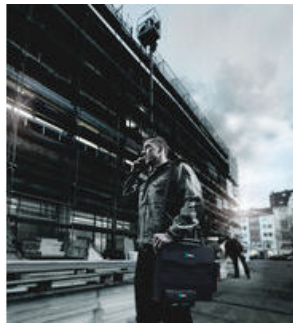
Wera 2go Werkzeug-Container mit Innen- und Außen-Klettsystem Individuell konfigurierbar für hohe Mobilität Ideal auch zum Andocken der textilen Wera Boxen und Taschen mit Klettzone Leichtes Ein- und Ausräumen Hände bleiben beim Transport frei