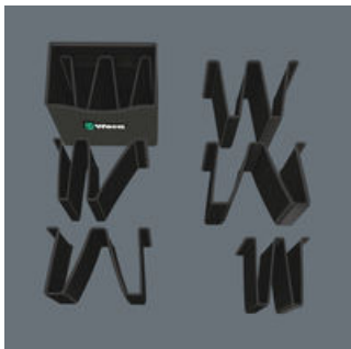
Der variabel einstellbare Klett-Teiler im Köcher sorgt mit bis zu 5 Einteilungen für Übersichtlichkeit und Ordnung.