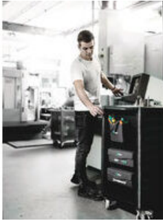
Wera 2go 4 Köcher