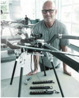
Die Wera Belts