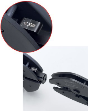
Gut sichtbare Kennzeichnung der Crimpeinsätze mit Piktogrammen